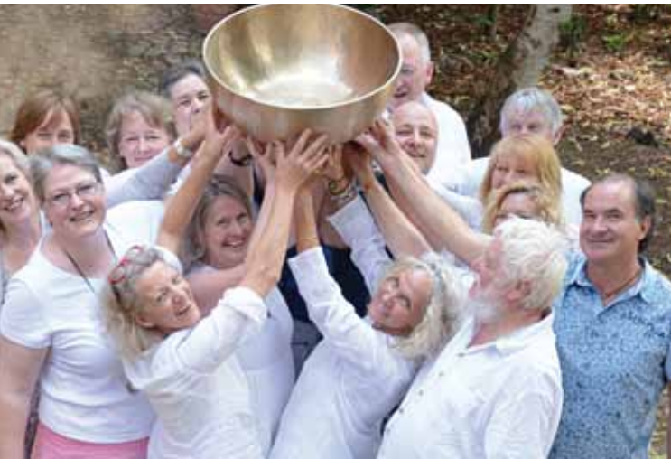
Die Ausbilder in der Peter Hess®-Klangmassage.

Viele Teilnehmer setzen die Klangmethoden zusätzlich und erweiternd in ihrem bestehenden Berufsfeld ein. Besonders interessant kann die Ausbildung aber auch für diejenigen sein, die sich ein völlig neues und sich selbst bereicherndes Berufsbild schaffen möchten.