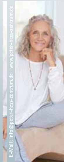
E-Mail: info@peter-hess-zentrum.de · www.peter-hess-zentrum.de