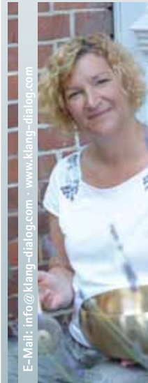
E-Mail: info@klang-dialog.com · www.klang-dialog.com

Großzügige, für die Arbeit mit Klängen gestaltete Räume bieten einen Treffpunkt zum Wohlfühlen, Entspannen oder Lernen. Die integrierte Praxis KlangDialog lädt ein, mit Klangmassage und Kursangeboten Ihre eigene Gesundheit zu stärken. Zahlreiche Seminare des Peter Hess® Institutes ermöglichen es, die Klangmethoden selbst zu erlernen.